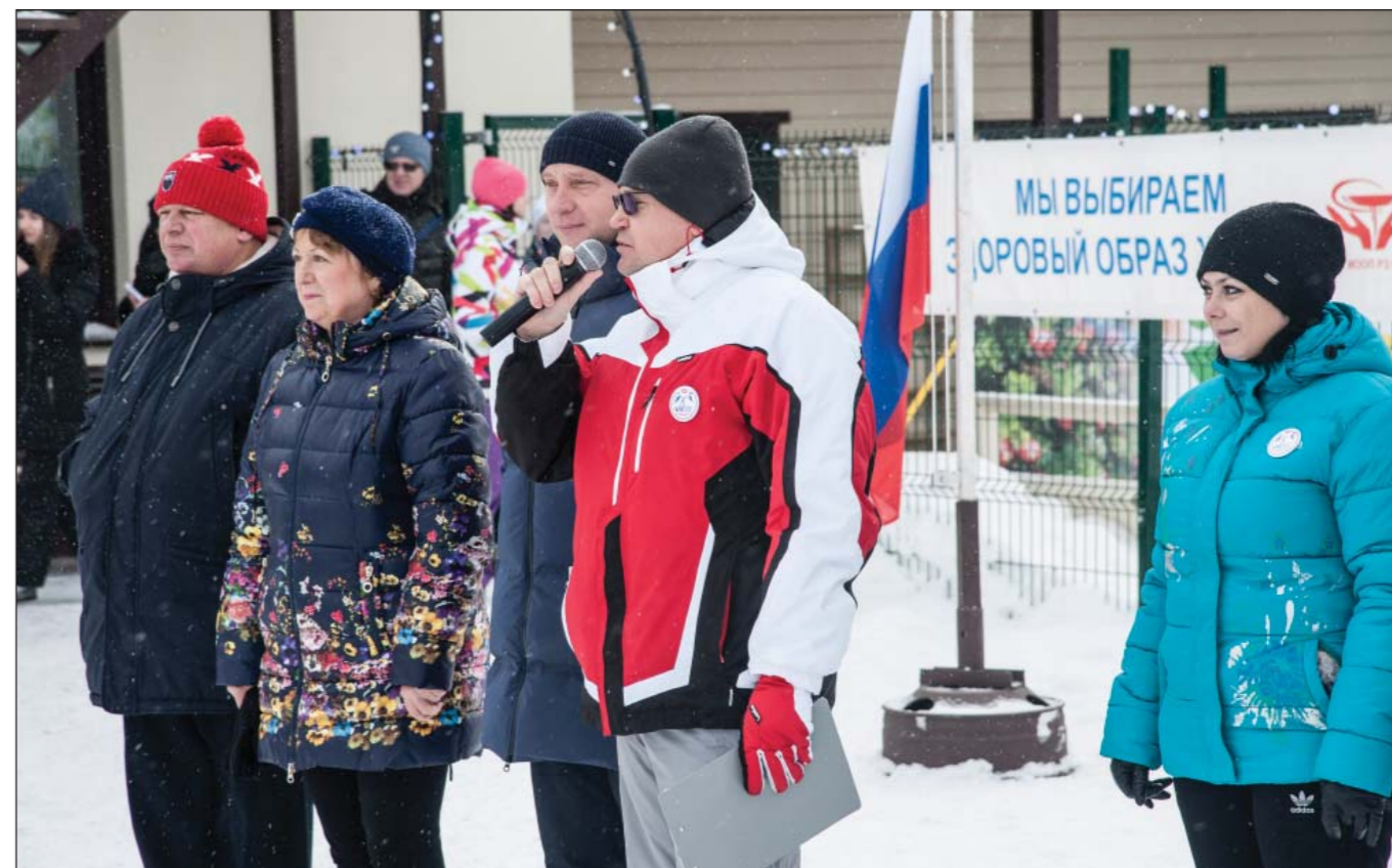
Традиционный Зимний спортивный фестиваль, организованный Московским областным комитетом профсоюза работников здравоохранения РФ, Орехово-Зуево, 2018 год.

нельзя. Ведь многие профлидеры на местах выполняют свою работу на общественных началах. А значит, нужен другой подход в работе с ними.